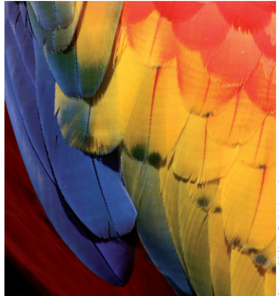
Guacamaya Roja

• Establecer comités de vigilancia participativa, en colaboración con la