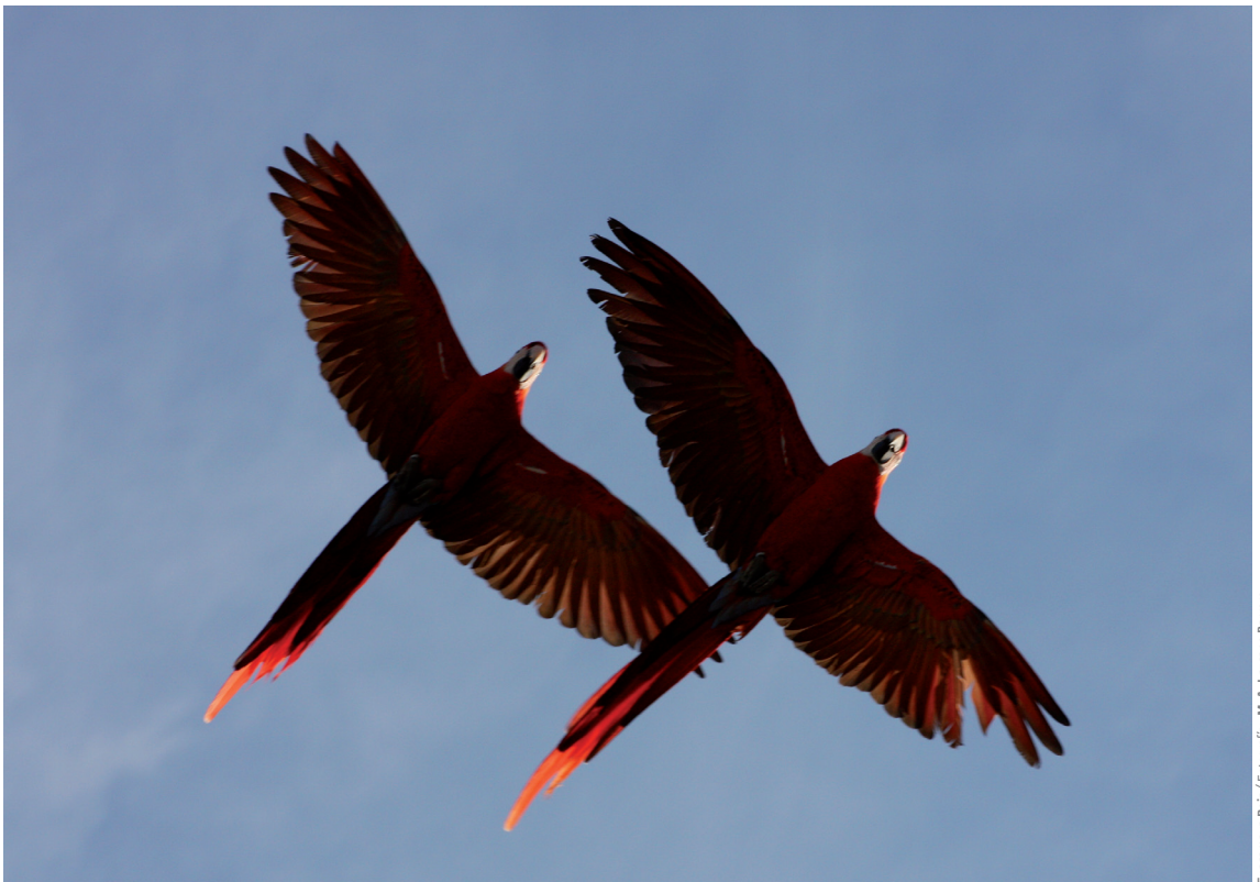
Guacamaya Roja

La guacamaya roja se distingue por su plumaje de color rojo escarlata y el color amarillo de las plumas cobertoras y secundarias de las alas, además de la ausencia de plumas en el rostro (Forshaw, 1989). Las plumas cobertoras de la cola presentan un color azul claro, mientras que las plumas cobertoras primarias son rojas. El pico de la mandíbula superior es de color hueso, mientras la mandíbula inferior es negro mate. El iris es color amarillo y las patas color oscuro. Los juveniles son similares excepto por el iris que es de color café claro (Forshaw, 1989).