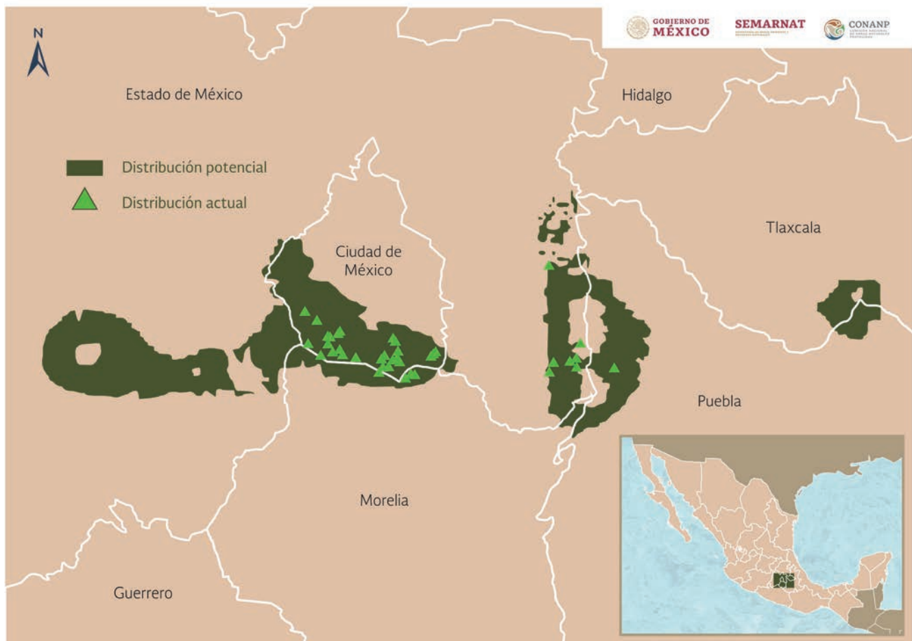
Figura 2. Mapa de distribución actual y potencial del Teporingo ( Romerolagus diazi ).

Rizo-Aguilar y colaboradores (2016) estimaron un área de distribución en el Corredor Biológico Chichinautzin con base en 174 registros directos e indirectos hechos entre los años de 2008 y 2011, utilizando ArcView 3.2 y los métodos de Minimum Convex Polygon y Fixed Kernel Isopleths ambos con un nivel de confiabilidad del 95%, determinaron que en una superficie de 657.2 km 2 del Corredor Biológico Chichinautzin, el Zacatucho tiene un área de distribución de 166.43 km 2 , mayor a la estimada con registros históricos. Por otro lado, Ramírez-Albores et al. , (2014) descubrieron una población de Zacatucho en el Parque Ecoturístico Piedra Canteada, lo que representa un nuevo registro de distribución en una localidad ubicada en el estado de Tlaxcala, aledaña al Monte Tláloc.